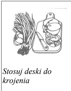
Stosuj deski do krojenia

Chociaż twarde (stąpią każdy dobry nóż) powierzchnie Cristalan / SSV / Hanex nie są przeznaczone jako powierzchnie do cięcia. Do przygotowywania żywności stosuj deski do krojenia z drewna, polietylenu czy bambusa – obędą się łagodniej z Twoim nożem i zabezpieczą przed przypadkowym zarysowaniem.