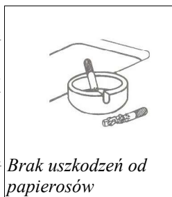
Brak uszkodzeń od papierosów

Ponieważ Cristalan / SSV / Hanex są produktami jednorodnymi pod względem koloru i wzoru w całym swym przekroju i są nieporowate, ślady po popiole papierosów lub uporczywe zaplamienia mogą zostać usunięte ściernym środkiem czyszczącym i gąbką Scotchbrite. Nawet drobnoziarnisty papier ścierny może zostać użyty bez groźby zniszczenia gładkiej powierzchni*.