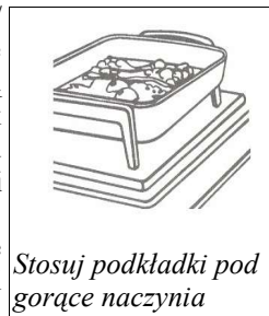
Stosuj podkładki pod gorące naczynia

Zawsze chroń Cristalan / SSV / Hanex przed źródłami ciepła, które mogą zniszczyć każdą powierzchnię, nawet tak trwałą jak Solid Surface. Dla ochrony przed gorącymi naczyniami wyjmowanymi z kuchenki czy piekarnika stosuj podkładki ochronne. Podobnie postępuj z urządzeniami wytwarzającymi ciepło jak żelazka, elektryczne urządzenia do smażenia, podgrzewacze itp.